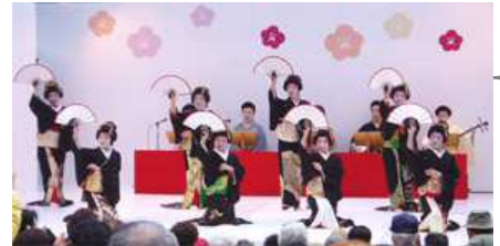
熱海芸妓連演芸会