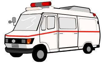
病院に運ばれた救急車 はこんな感じ、..

年末はクリスマスがありますので、レストランもさることながら、ケーキ屋さんにとってもっとも忙しい時期です。 クリスマス前は、不眠不休の日々が続くのもめずらしい事ではありません。